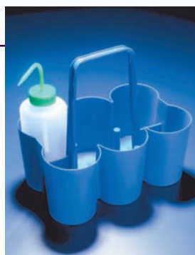
Transportador de frascos de polipropileno.